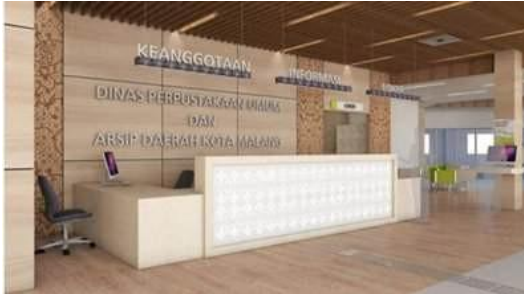
GAMBAR 4. PENGGUNAAN MOTIF BATIK PADA PERPUSTAKAAN (SEPTIANI, 2018)

dan pengenalan budaya visual lokal kepada generasi muda. Dengan demikian, perpustakaan berfungsi sebagai wahana pendidikan budaya yang hidup, di mana interior menjadi ruang naratif yang menyampaikan nilai-nilai lokal melalui elemen desainnya.