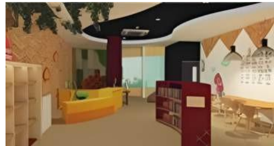
GAMBAR 6. PENGGUNAAN ZONASI RUANG TEMATIK (NOFA & RUCITRA, 2018)

tersebut menjadikan perpustakaan sebagai ruang interaktif yang edukatif sekaligus mendorong keterlibatan aktif masyarakat dalam pembelajaran budaya.