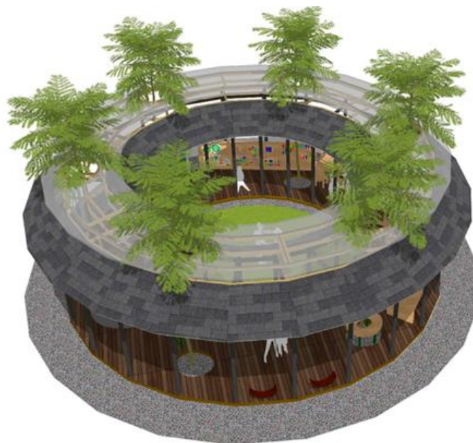
GAMBAR 4. TAMPAK ATAS TAMAN RAMAH ANAK