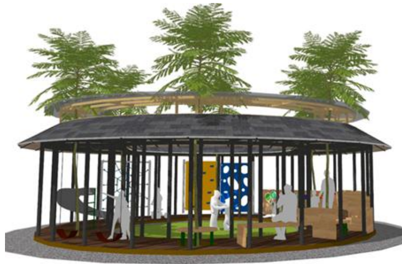
GAMBAR 3. TAMPAK TAMAN RAMAH ANAK

tersebut. Bangku-bangku ini diharapkan menjadi ruang yang nyaman bagi anak-anak untuk berkumpul, berbagi cerita, dan mempererat hubungan sosial mereka di luar lingkungan kelas.