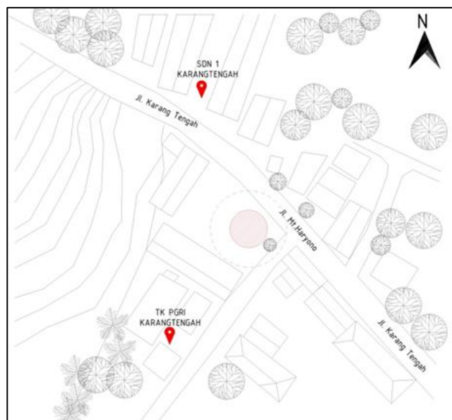
GAMBAR 1 LOKASI SITE PADA AREA YANG DIARSIR

Dari berbagai pertimbangan mengenai desain taman yang diuraikan dalam diskusi sebelumnya, akhirnya berkembang menjadi dasar dasar di mana perencanaan taman ramah anak di Desa Karangengah dirumuskan. Di antara pertimbangan penting ini adalah pemilihan lokasi yang cermat yang tidak hanya diposisikan secara strategis tetapi juga mudah diakses, yang mengharuskan berada di dekat TK PGRI dan SDN 1 Karangengah dan terletak di sepanjang jalan untuk memfasilitasi akses yang nyaman bagi anak-anak dan orang tua mereka. Penggambaran selanjutnya pada Gambar 1 menggambarkan site terpilih yang ditunjuk untuk taman ramah anak yang diusulkan, menampilkan penempatan strategisnya dan kemudahan siswa TK dapat mencapainya.